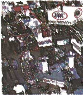
La conferencia anual de biotecnología tendrá lugar el 4 y 5 de marzo de 2010 en el Centro de Convenciones.

Algunas de las compañías participantes que estarán exhibiendo son: Emerson Process Management, MG America Inc., BOSCH Packaging Technology, Qosina Corp, C-Axis, IMA North America, Inc, Honeywell HPS,