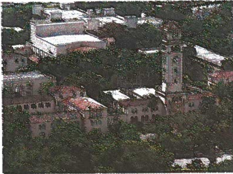
Los fondos ARRA otorgados subvencionarán investigaciones sobre los procesos de regeneración del pepino de mar.

Esta subvención de $149,000 la otorgó el NIH a través de su división National Institute of Nervous Disorders and Stroke.